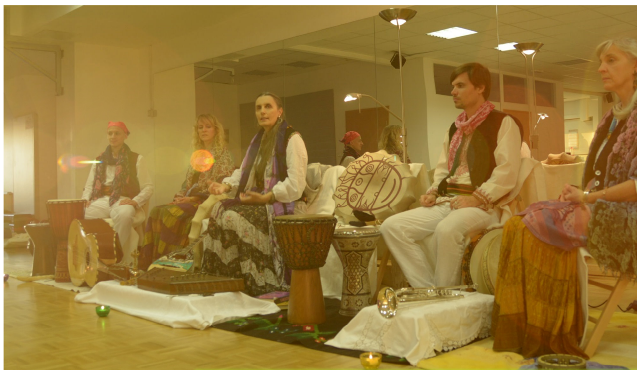
Magija in igra svetlobe na tečaju o ciganski kulturi (MaxxFit, Ljubljana, november, 2016)