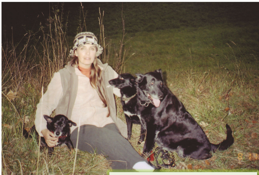
Z rešenimi zapuščenimi psičkami v gozdu (2007)

Moja življenjska zgodba je zgodba človeka in iskalca sreče, ki je, predvsem, zaradi potrebnega učenja, sprva hiral od žalosti in zaskrbljenosti, nesrečnih čustev in brezupa. A se mi je uspelo s prebujanjem zavedanja o človekovih zatajenih zmognostih dvigniti iz težav in tudi preseči bolezen ter premagati uničujoče sile rušilnih čustev in misli. Je pripoved človeka, ki se je