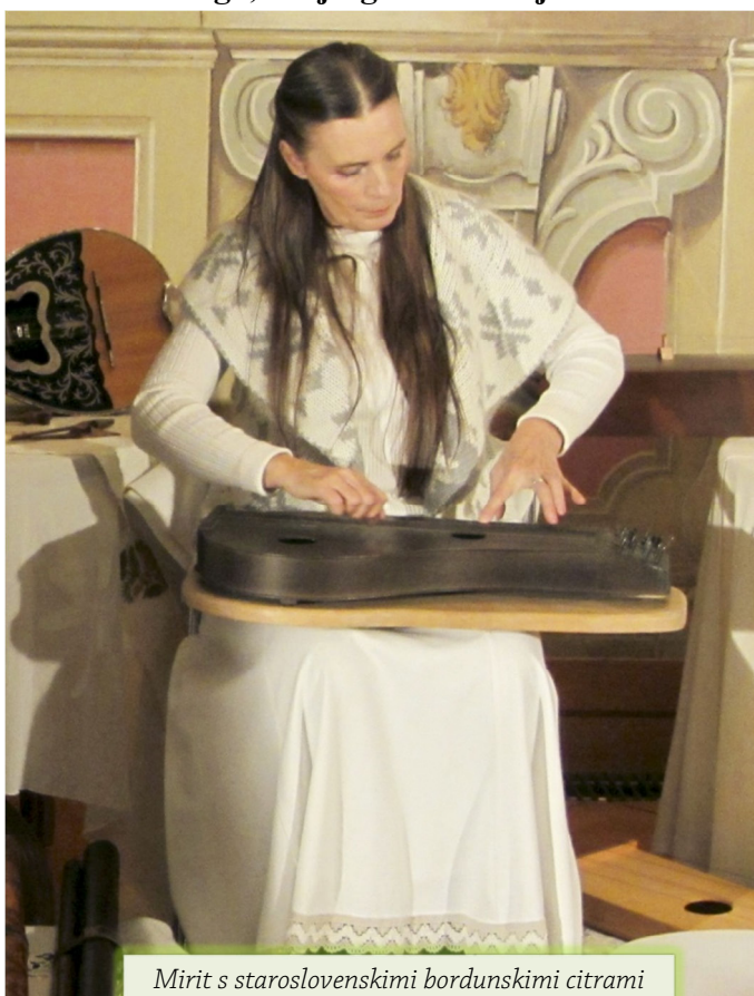
Mirit s staroslovenskimi bordunskimi citrami švrkovencami (Čekinov grad/Ljubljana, 2011)

Da, zares živimo v izjemnem času. Po eni strani je pritisk kaosa, sredi katerega smo, vse večji, vendar pa po drugi strani zaradi tega v ljudeh vse bolj intenzivno raste potreba po izgradnji etike in vrednot, ki bi ljudem prinesle notranji mir. Svet, kot ga poznamo, razpada, hkrati pa se postavljajo novi temelji novega sveta in časa. Trenutno živimo v čas bujenja in oživljanja pozabljenih vrednot - ki so tudi našim prednikom zagotavljale srečno življenje. In blagostanje. Gibljemo se k umu luči. Kristalizirajo se nepredstavljive nove tehnologije energije, zvoka in (čistih) misli. Zadnja desetletja je človeštvo delovalo predvsem z racionalnim umom leve polovice možganov, sedaj mora ponovno obuditi tudi intuitivno zaznavanje desne polovice možganov, ki nas telepatsko povezuje z večno modrostjo prednikov, z vseprisotnim