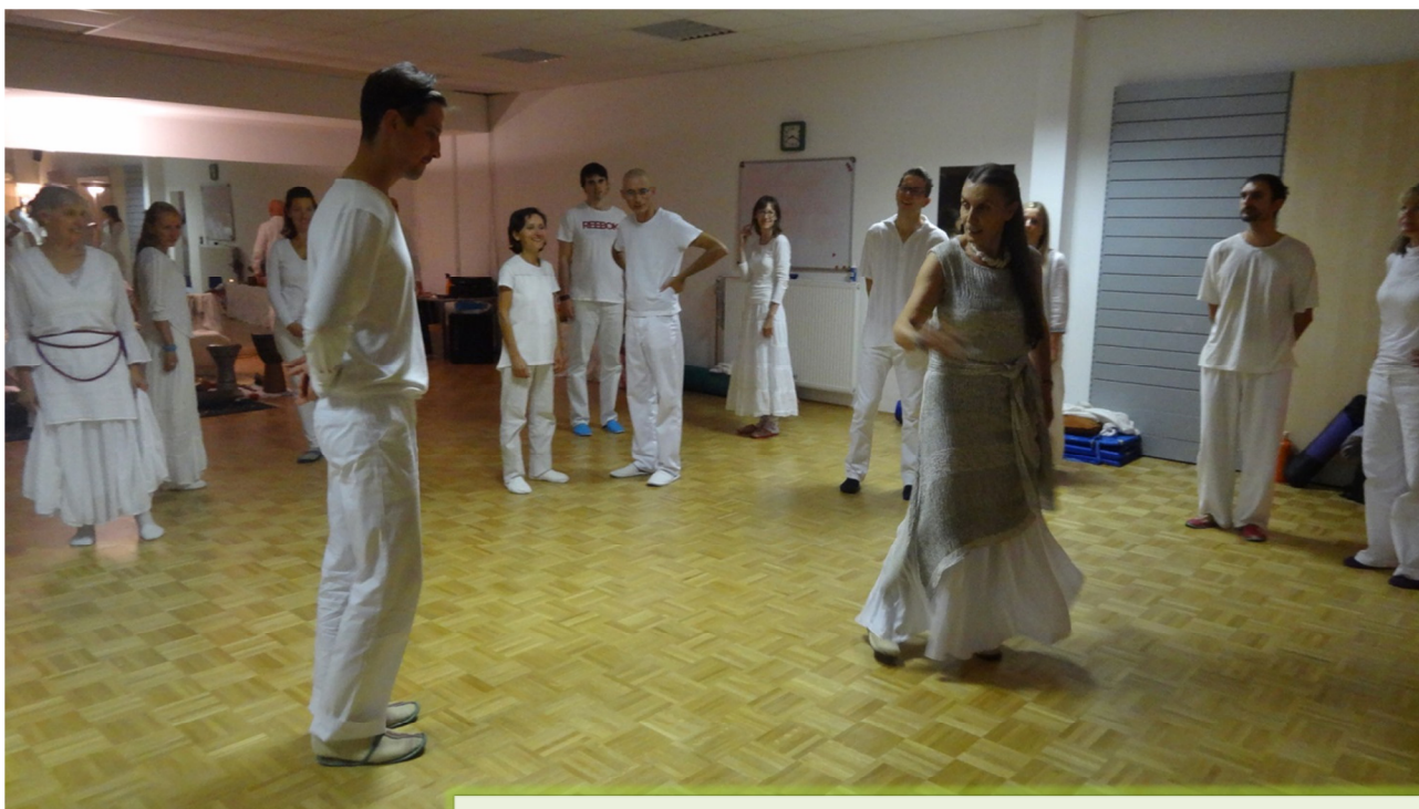
Radostni ples po končanem intenzivu o slovanskih modrostih (Ljubljana, oktober, 2016)

večje potrebe po posedovanju številnih informacij, kar je žal postalo še bit našega izobraževalnega sistema. A je vse skupaj docela neživljenjsko in nepotrebno. Temu se upirajo mladi.