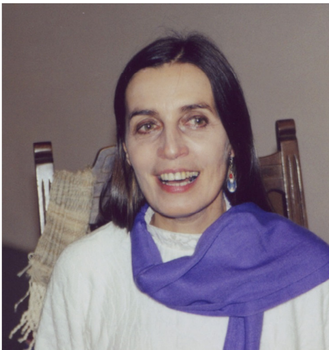
Mirit po koncertu v galeriji Equrna (Ljubljana, 2000)

Nato sem uzrla močan snop svetlobe, ki je pritekal od zgoraj, se spustil na vrh moje glave, me vso obsijal in odel v energijski plašč, nato pa se skozi roki izlil v bolečini zvičajoče se možgano telo. Ob tem me je ovil silen občutek ljubezni, miline in veličastja dogajanja ter globoki mir in posvečenost.