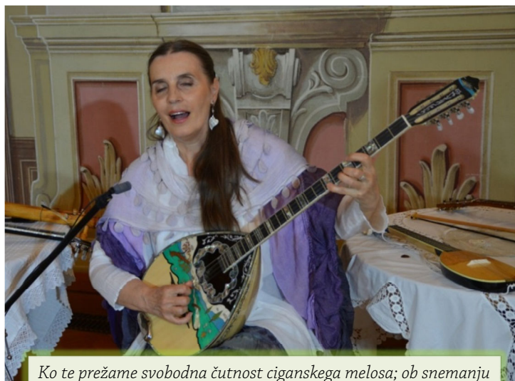
Ko te prežame svobodna čutnost ciganskega melosa; ob snemanju buzuki CD-jev v Cekinovem gradu (maj, 2014)

Odgovor je izjemno preprost: smisel življenja se razodeva v duhovni rasti in v preobrazbi duhovno neljubeznivih in rušilnih misli, čustev ter odzivanj v ljubeče prebujeno sobivanje, v katerem naj bi človek dojel in zaživel vse ravni ali dimenzije bivanja – tako zemeljske kot duhovne in kozmične (prvobitne); celoto ali celovitost življenja na Zemlji; Troedinost, Enovitost, po ljudsko – devet različnih (frekvenčnih) svetov resničnosti. To pa gradimo le s čuječnostjo in budnostjo in zmedenost spreminjamo v uglašenost ali harmonijo. Slediti velja vse višjim ali širšim življenjskim idealom. Da bi na vseh življenjskih ravneh večdimenzionalnega bitja vzpostavili resonanco ali harmonijo, moramo očistiti tudi podzavest in celični spomin rušilnih travm in stresov ter se odpreti odtisom ali zvočnim vibracijam popolnega. Tako vzpostavljamo red v kaosu. Dovršenost. Prebujenost.