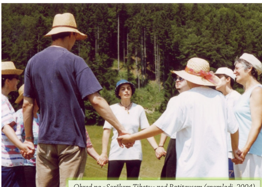
Obred na »Sorškem Tibetu« pod Ratitevcem (spomladi, 2004)