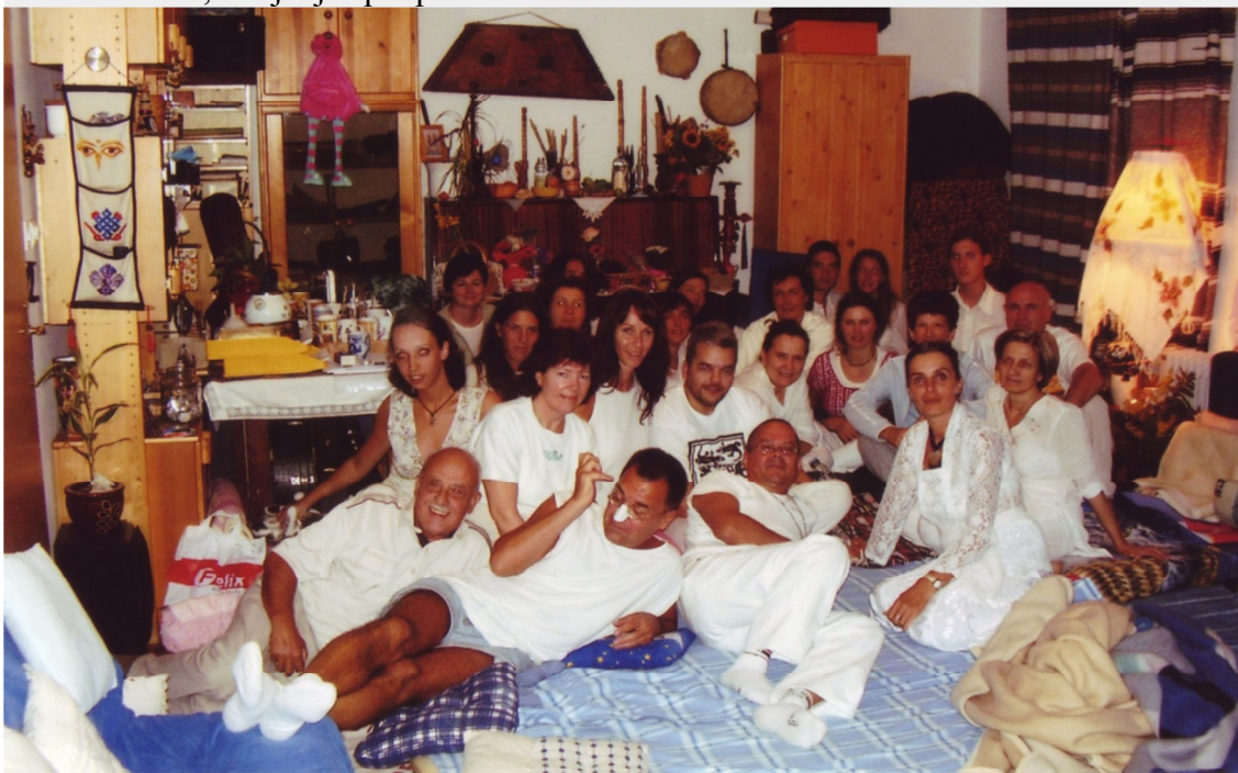
Tečajniki šole Veduna pod Kureščkom (2007)

Moja kozmično-zemeljska "kirurška" pot je pot z energijo in močjo zvoka. Po opogumljanju filipinskih kozmičnih kirurgov sem ugotovila, da bom očitno morala sama razviti in obuditi »nekrvavo« zvočno kirurško orodje. Tako ob pomoči zvočnih vibracij in entitet že vrsto let uspešno "operiram blokade" ter neravnovesja na eterskih in nematerialnih telesih; zatem se vse novo ravnovesje počasi prenese tudi na fizično telo. Navzoči ob tem slabosti in nered v sebi tudi izkričijo in izjočejo. Učinki so presenetljivi: ljudje se počutijo prenovljeni, bule in celo rakaste tvorbe izginjajo, snovno in nesnovno se uravnoveša, življenje spet prežame radost.