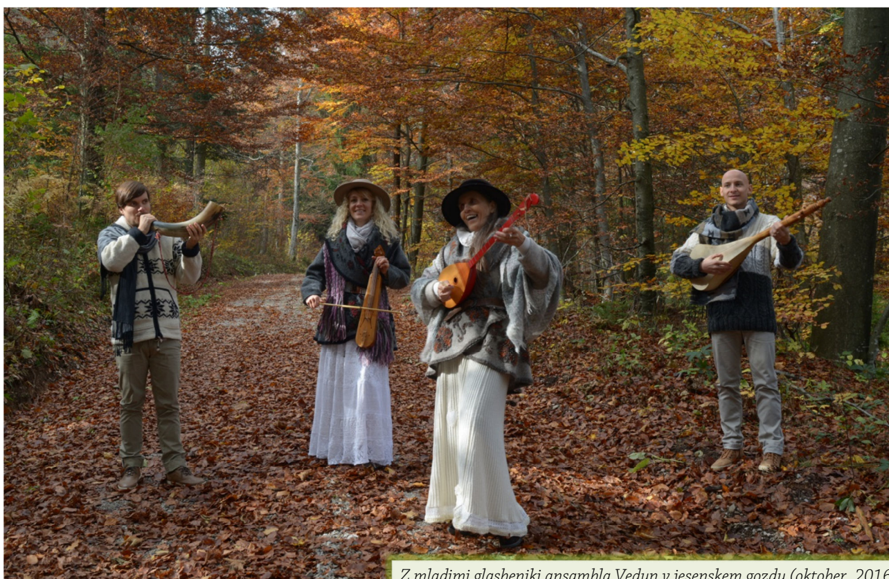
Z mladimi glasbeniki ansambla Vedun v jesenskem gozdu (oktober, 2016)