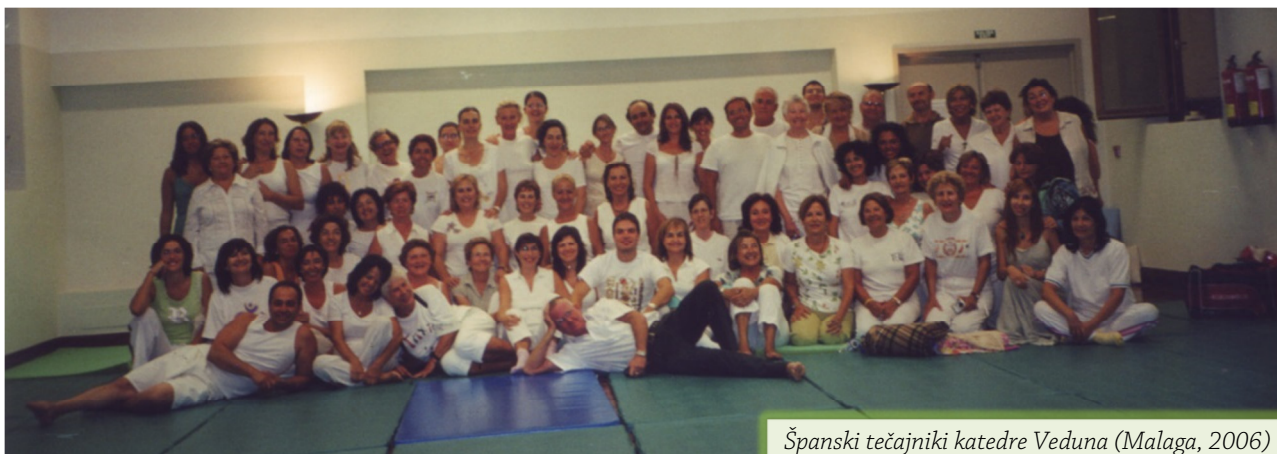
Španski tečajniki katedre Veduna (Malaga, 2006)

Prvo spontano duhovno iniciacijo pa ste doživeli že v otroštvu, pri dvanajstih letih, ki velja v različnih šamanskih tradicijah kot izjemno pomembno.