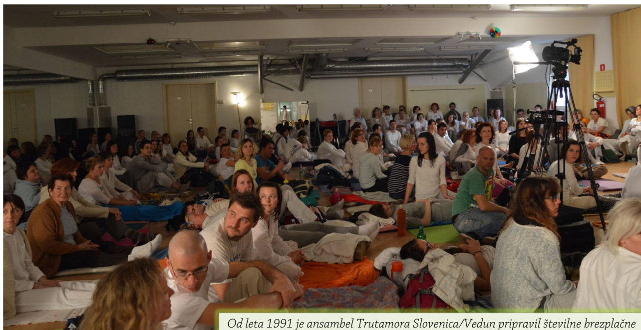
Od leta 1991 je ansambel Trutamora Slovenica/Vedun pripravil številne brezplačne koncerte in zvočno-energijske kirurgije (Buba/Ljubljana, Veduna - Sensin dan, 2014)