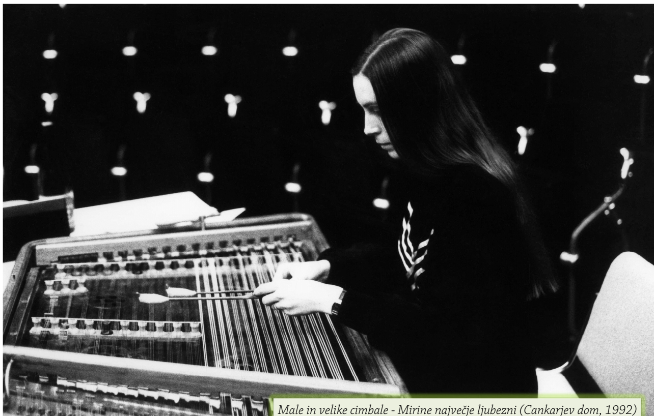
Male in velike cimbale - Mirine največje ljubezni (Cankarjev dom, 1992)