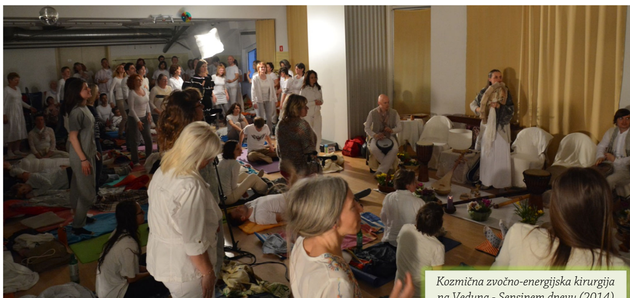
Kozmična zvočno-energijska kirurgija na Veduna - Sensinem dnevu (2014)

pogosto pozabi. Pomagamo pa seveda tudi beguncem.