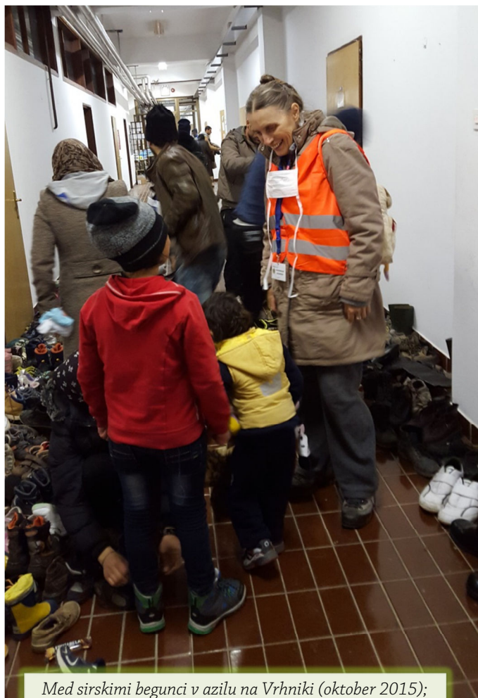
Med sirskimi begunci v azilu na Vrhnikih (oktober 2015); Mirit in tečajniki pogosto pomagajo ljudem v stiski

Odkrivanje in razgrajevanje notranjih saboterjev je pomemben del vseživljenjskega ozaveščanja, ki je nujno za samourejanje, širjenje zavesti in zavedanja (tudi namena življenja) in s tem tudi za zdravljenje. Povabiti moramo »ranjeno dete« (sebe), da razkrije svoje neljube vsebine (saboterje sreče) ter odpravi (boleče) razglašene zapise (čustva in misli, strahove, zamere ...). Odkriti moramo psihično dediščino, ki smo jo podedovali tudi v odnosih s starši, sorodniki, vrstniki ... Le tako se lahko osvobajamo rušilnih ravnanj zasidranih v nezavednem. Po kozmičnih zakonitostih sozvenenja se nam znova in znova ponavljajo boleča izkustva, neljube situacije in neuglašeni odnosi – tako vse dokler ne dojamemo, kaj nosimo v sebi in kako ravnamo. Vse dokler rušilno ne odpravimo. Takšen je mehanizem prepoznavanja potisnjene bolečine in duhovnih nezrelosti. Šele ko ozavestimo, kar nosimo v sebi le-to lahko odпустimo iz svojega zavestnega in energijskega polja. Tako s pomočjo bolečih izkustev iz preteklosti uresničujemo lastne vsebine ter polnino zavedanja in radostnejši jutri. V tem tiči bistvo življenja. Vse, kar se nam dogaja, je podrejeno tem procesom.