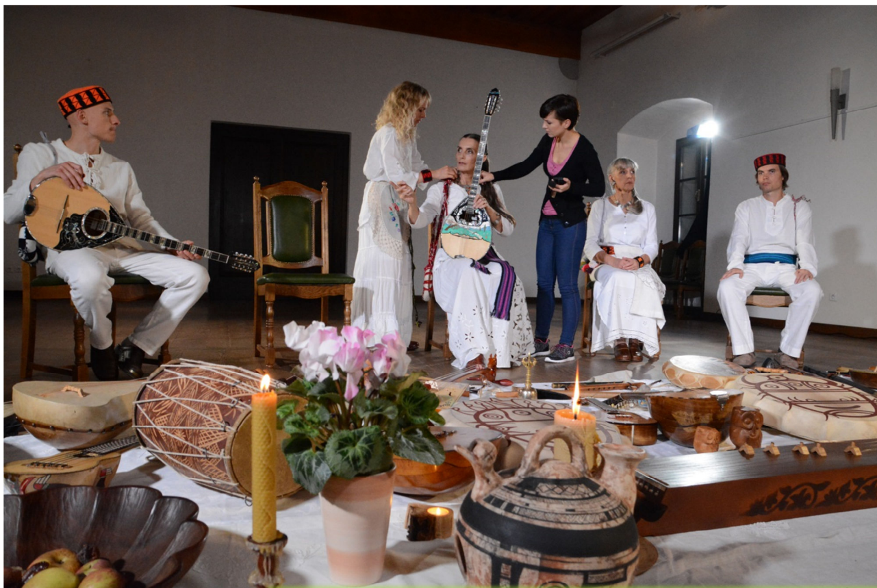
Glasbeniki ansambla Vedun v maski pred snemanjem filma (grad Turjak, oktober, 2015)