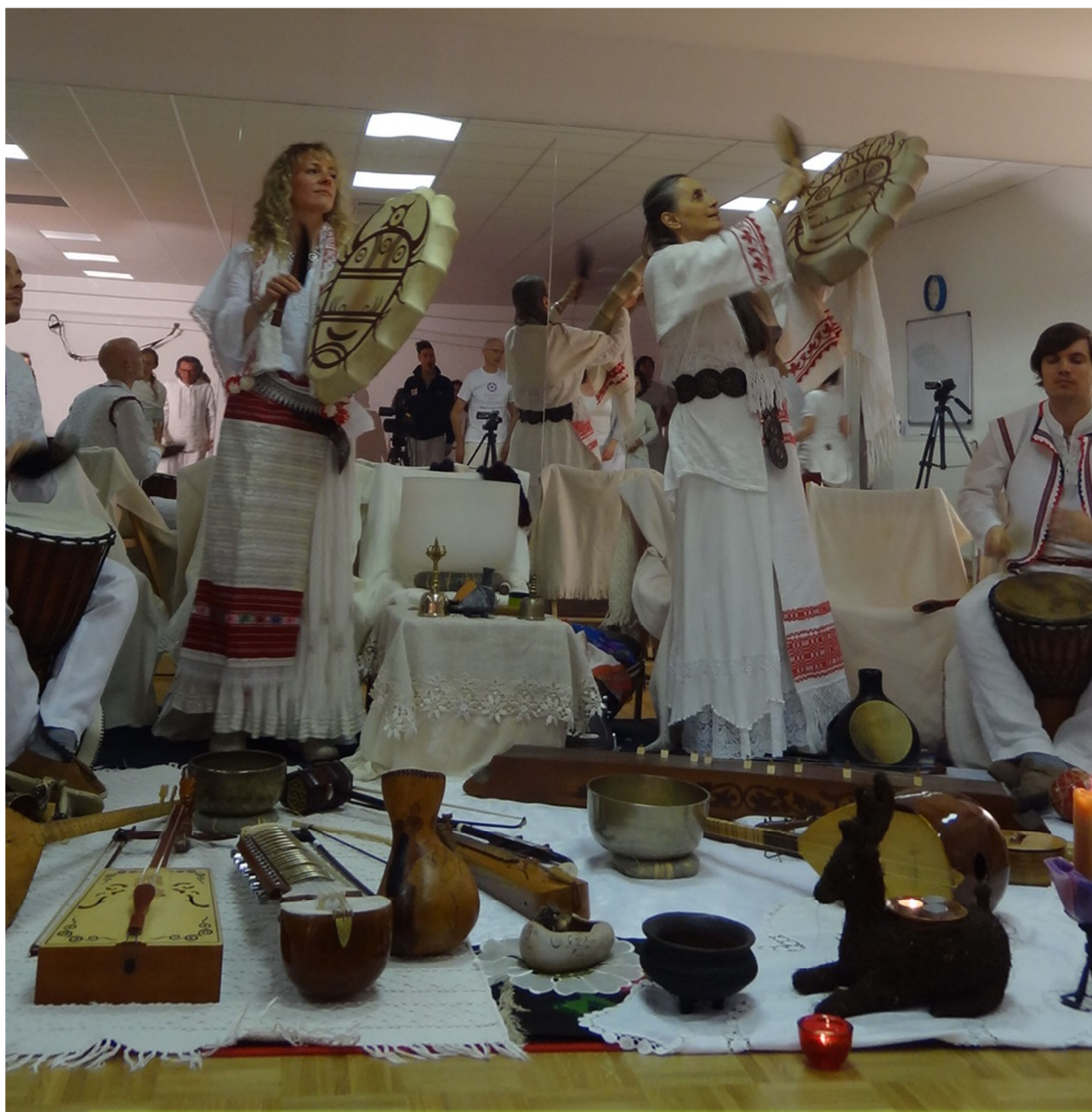
Med oživljanjem slovanske in staroslovenske kulturne in glasbene dediščine; v makedonskih oblačilih (Ljubljana, 2015)

Ta prehod onstran razdvojenega konfliktnega življenja, ki mu pravimo tudi dolina solz, onstran ogroženosti in teme torej, se lahko zgodi, ko je zavest dovolj široka, ozaveščanje dovolj tenkočutno in jasno, misli in čustva očiščena, srce dovolj odprto, delovanje pa podrejeno služenju planetu in drugim – brez zgolj pridobitniških zahtev in pričakovanj. S prebuditvijo oz. z razsvetljeno zavestjo uzremo smisel in nesmisel dogajanj, situacij, odnosov... Doživimo izkušanje lahkotnejšega