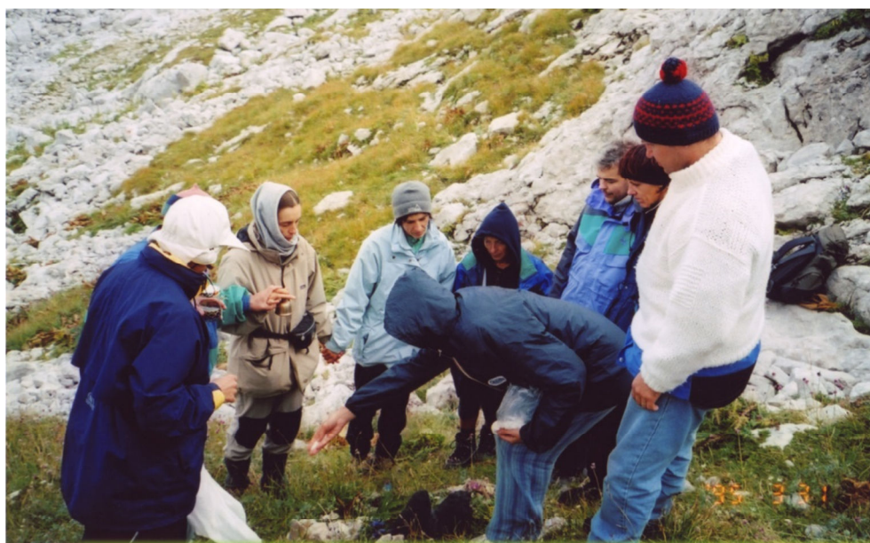
Odpiranje kozmično-zemeljskega portala za Slovenijo na sveti gori Krn (september, 2004)

dveh ali treh sekundah so se v meni zavrteli filmi mojega in moževega življenja, ob tem pa še svojevrstno zavedanje trenutnosti. Vsega, kar se je odvijalo. Ko sem pristala na tleh, sem možu nato brez vprašanj intuitivno položila roke na križ. V trenutnem docela jasnem uvidu sem