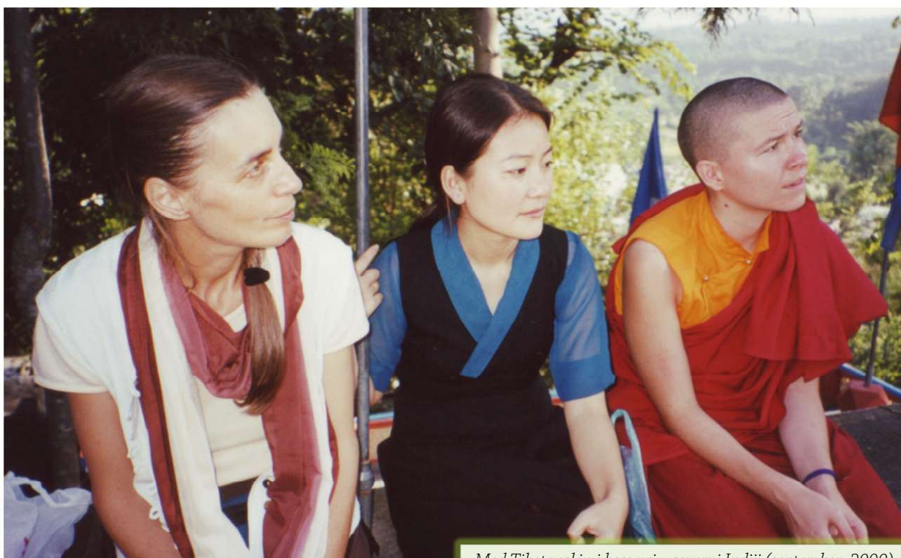
Med Tibetanskimi begunci v severni Indiji (september, 2000)