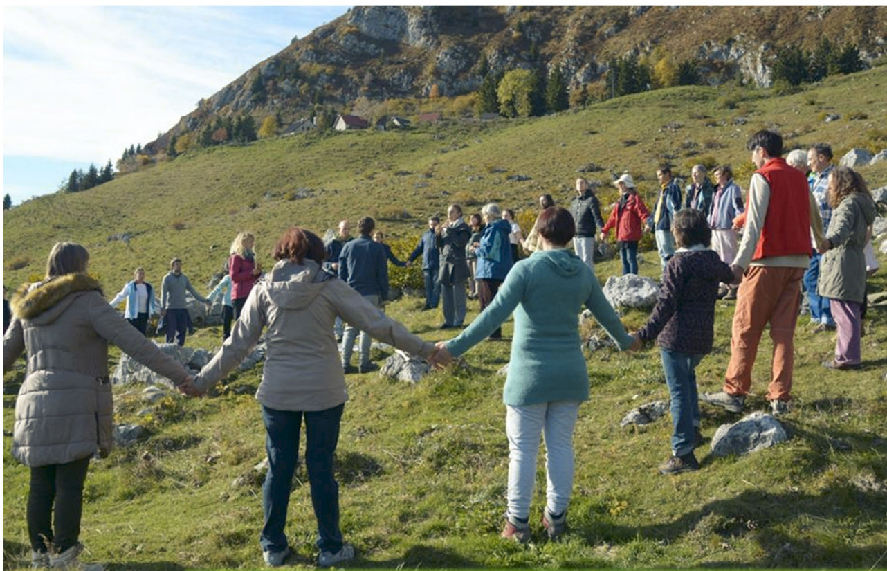
Energijsko vzdrževanje in odpiranje kozmičnega mostu na krnskem megalitskem krogu (oktober, 2016)

preprosto vedela, da jih moram položiti prav tja.