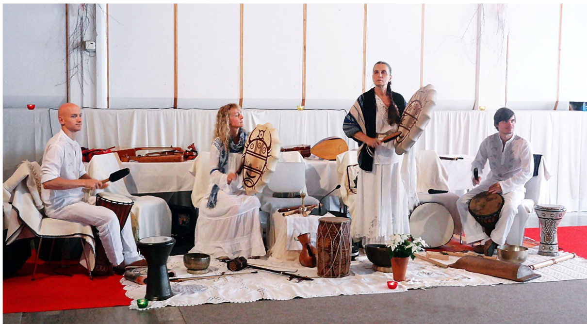
Akcija (Rogla, 2016)

sem tu! No, Joao, ki ga vodijo različne entitete in med operacijo posega kar z golo roko globoko v telo in pogosto kri škropi na vse strani, običajno dela brez zavedanja o tem, kaj in kako v transu operira, mi je že ob prvem obisku ponudil vrsto zanimivih izkušenj , ki pa so bile očitno zelo potrebne pri vzpostavljanju lastne kozmične zvočno-energijske kirurgije , precej drugačne tudi od vseh drugih znanih na našem planetu, drugačne tudi od brazilske, Joave in filipinske . Izjemna je bila leta 2001 tudi izkušnja kozmičnega mostu med Zemljo in Virom življenja, kar sem popisala tudi v svoji knjigi (iz serije Kozmična telepatija) na temo brazilske in filipinske kozmične kirurgije (knjiga je žal še neobjavljena). »Janez od Boga« mi je leta 2001 daroval tudi prvo možnost občutenja neobičajnega in čudežnega kozmičnega kirurškega delovanja ali skalpela , ki je steklo prvič skozme ob prisotnosti brazilskega medija. Joao me je prijel za roko in me (vódeno) nenadoma potegnil na oder. V naslednjem trenutku sem padla v globoki trans, kot da bi poprej meditirala več ur.