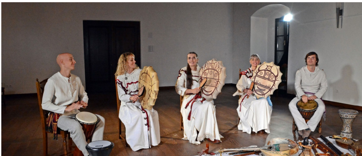
Ansambel Vedun v svečani slovanski opravi in s šamanskimi bobni (grad Turjak, 2015)

sem tu! No, Joao, ki ga vodijo različne entitete in med operacijo posega kar z golo roko globoko v telo in pogosto kri škropi na vse strani, običajno dela brez zavedanja o tem, kaj in kako v transu operira, mi je že ob prvem obisku ponudil vrsto zanimivih izkušenj , ki pa so bile očitno zelo potrebne pri vzpostavljanju lastne kozmične zvočno-energijske kirurgije , precej drugačne tudi od vseh drugih znanih na našem planetu, drugačne tudi od brazilske, Joave in filipinske . Izjemna je bila leta 2001 tudi izkušnja kozmičnega mostu med Zemljo in Virom življenja, kar sem popisala tudi v svoji knjigi (iz serije Kozmična telepatija) na temo brazilske in filipinske kozmične kirurgije (knjiga je žal še neobjavljena). »Janez od Boga« mi je leta 2001 daroval tudi prvo možnost občutenja neobičajnega in čudežnega kozmičnega kirurškega delovanja ali skalpela , ki je steklo prvič skozme ob prisotnosti brazilskega medija. Joao me je prijel za roko in me (vódeno) nenadoma potegnil na oder. V naslednjem trenutku sem padla v globoki trans, kot da bi poprej meditirala več ur.