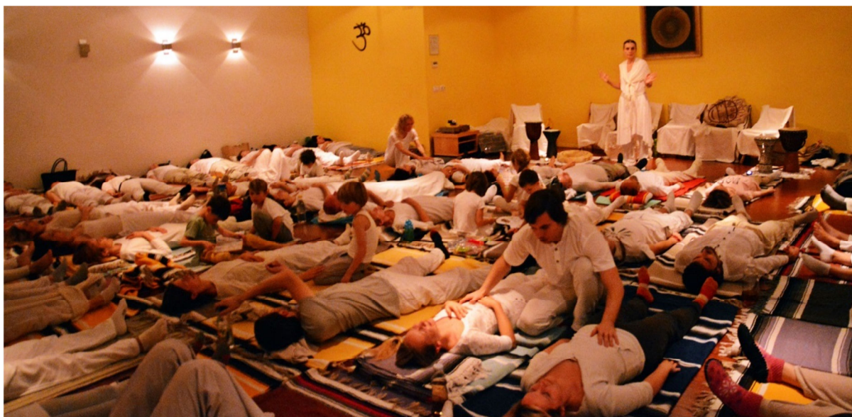
Kirurgija na daljavo in z dotikom (Ljubljana, 2016)

moj glas kot tudi s pomočjo dotika, napravijo na ljudeh tisto, kar ljudje tisti hip najbolj potrebujejo. Pa se zgodi samo po sebi.