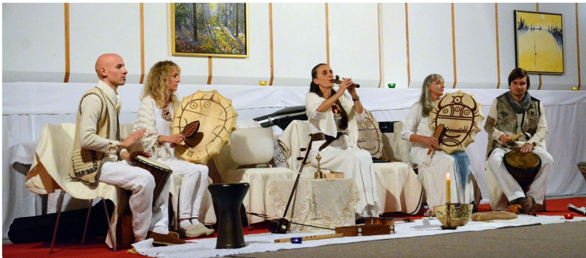
Kozmična zvočno-energijska kirurgija ansambla Vedun

duhovni učitelj. Zato je najin odnos tudi zelo zahteven . Pogosto tudi zelo naporen , seveda. V njem ni mesta za površnost . Le doslednost , discipliniranost , zavzetost , natančnost , pozornost , predanost samorazvoju . Starševska vloga je v tej navezavi še najlažja. Svečenik ali šaman si ne more nikdar privoščiti napak. Če pa si jih, vede ali nevede, to tudi izkusi na sebi kot bolečino ali v obliki drugačnih težav.