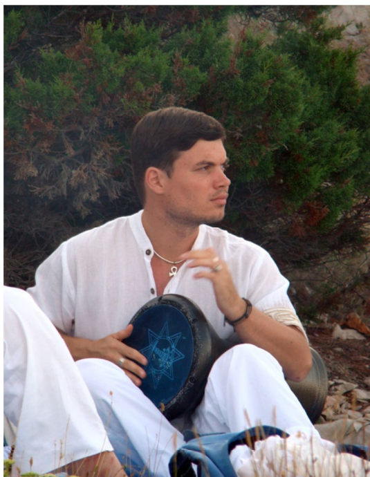
Mirin sin Tine z arabsko-balkansko darabuko ureja energije (Iž, 2007)

meni neštete do tedaj prikrite in še speče sposobnosti – dar kozmične telepatije ter povezovanja z Izvornim Poljem in energijami ter dar kozmične kirurgije. Vsega tega brez predhodnega ne bi bilo. Že pred pričetkom novega tisočletja pa je bil tudi ansambel spontano potisnjen v zavzeto iskanje sozvočij (tišine), v intenzivno (samo)spreminjanje, (samo)-uresničevanje in duhovno rast; da bi zmogli skozi svojo zavest in telesa prevajati čim čistejše in močnejše valovanje (to je čim višje frekvence), kar je temelj zvočno-energijske kirurgije. Koncerti ansambla Trutamora Slovenica/Vedun so postali močna terapija. Ljudje, ki so prišli sicer poslušat pesmi in glasbila iz Slovenije in drugih kultur, so odhajali domov drugačni. Spremenjeni. Niso bili več enaki kot poprej.