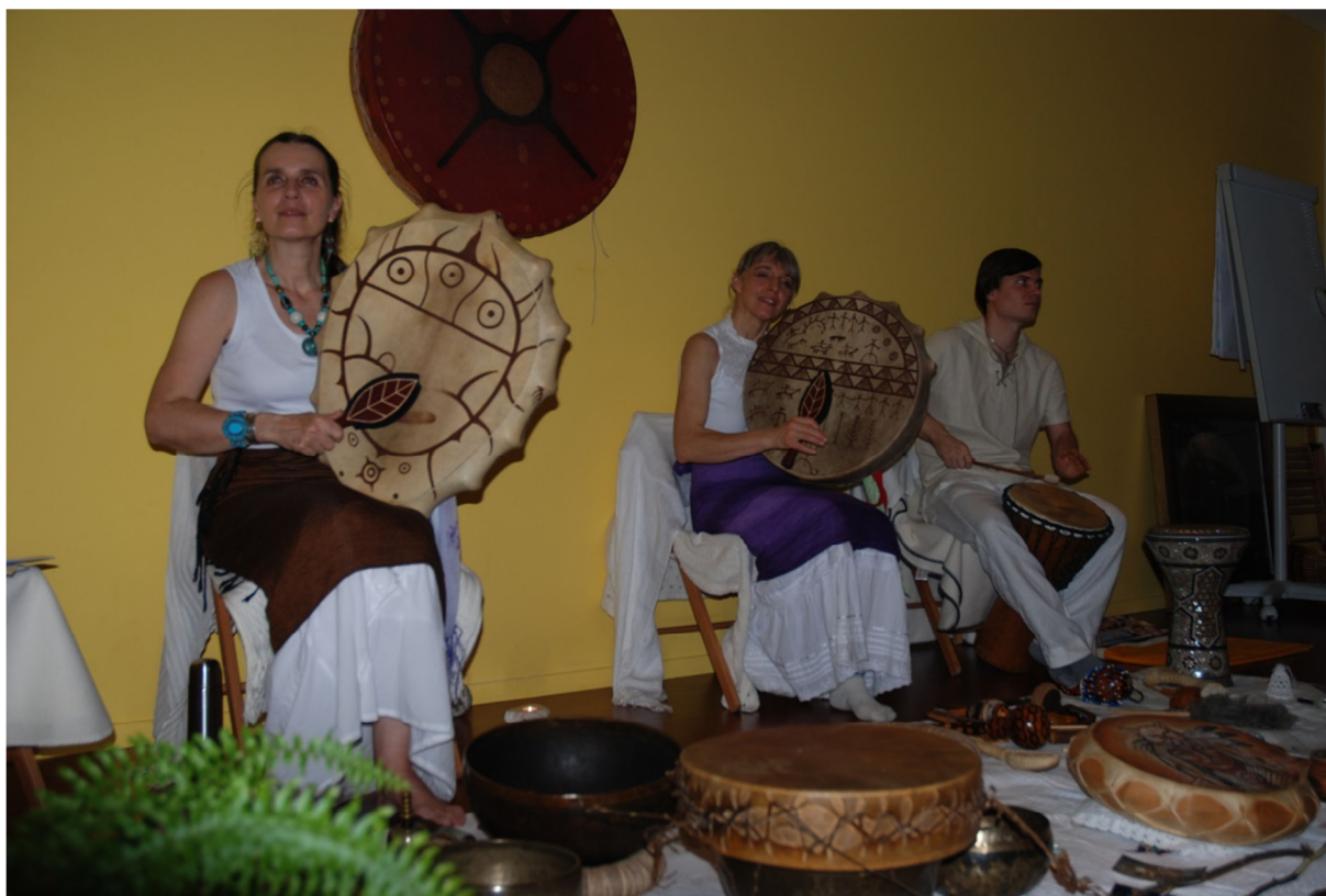
Radost kirurgije – moč v spreminjanju