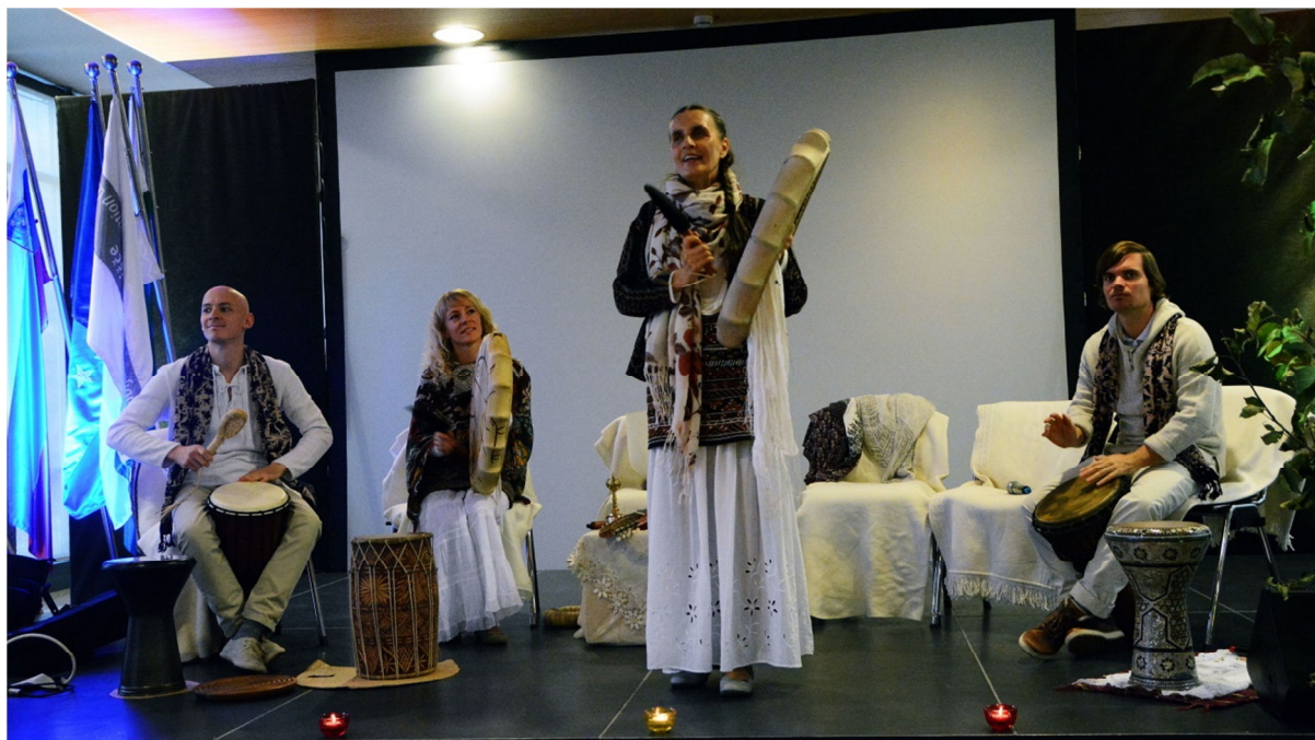
Veduna kirurgija na Gospodarskem razstavišču (2015)

frekvenčno valovanje , tako visoko, kolikor ga telo le zmore prevajati. To zviševanje frekvenc skozi mene se od leta 2000 samo še širi oziroma povečuje . Iz leta v leto, iz dneva v dan; kirurgija pa s tem postaja vse močnejša, hitrejša, učinkovitejša . Z duhovnim zorenjem se širijo človekove sposobnosti. Vse manj se izgubljam v starem in prežvečenem. Vsak nov dan – nova avantura! Novo, drugačno, neznano, čudovito, naravnost opojno in čudežno . Izkusila sem različne procese za izboljšanje prevajanja življenjske energije, med njimi je bil