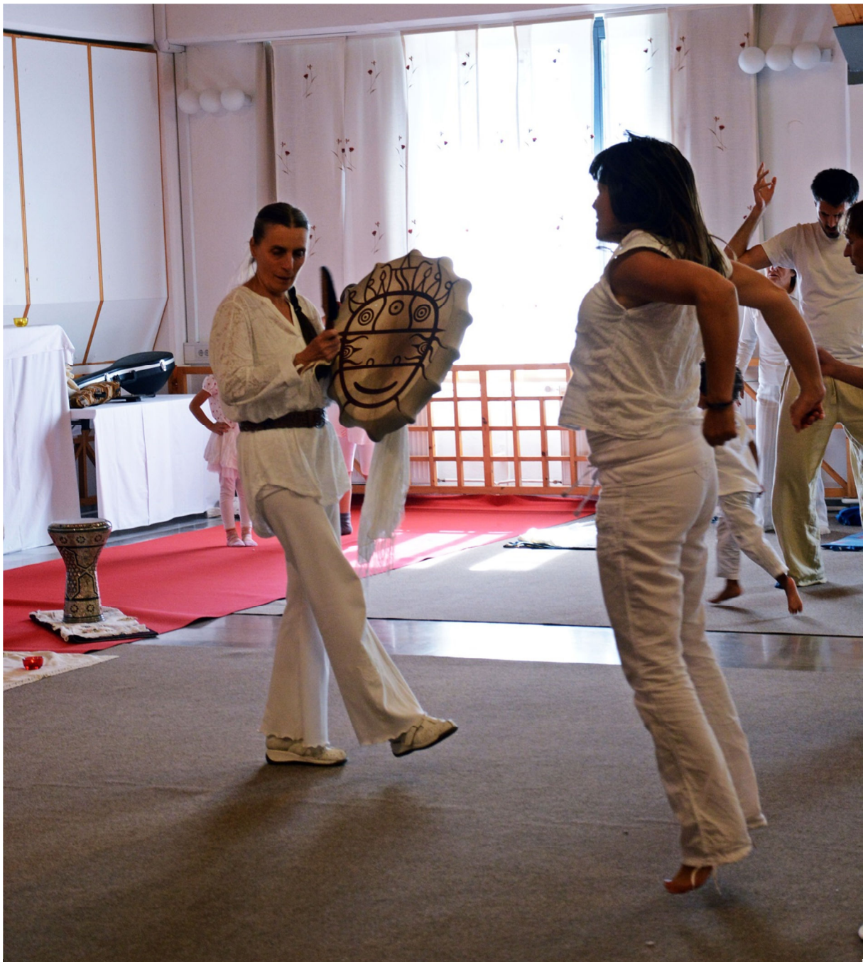
V trans izkušnjah kdo tudi poleti (Rogla, 2014)