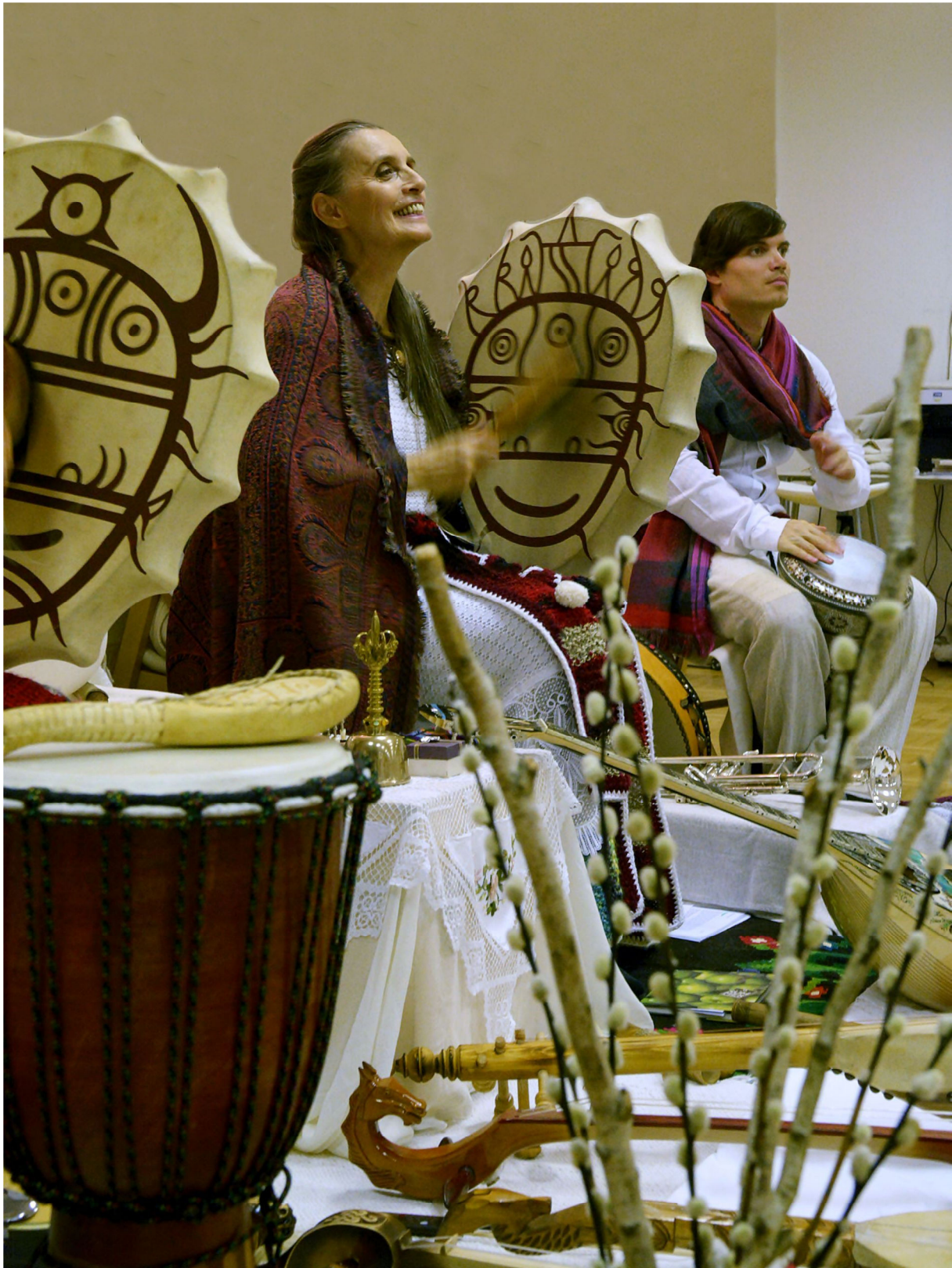
Mirit in Tine urejata in operirata s pomočjo slovanskih šamanskih bobnov

bolj natančne. Telo, razbremenjeno trdnosnovne hrane, je postalo imeniten prevodnik in prevajalnik ter posrednik življenjskega frekvenčnega valovanja v snovni svet . Življenjska energija, ki se steka skozi fizično in duhovno očiščenega medija , lahko skozi povsem očiščeno fizično telo, um in čustva, teče brez ovir ali zastojev . Predvsem pa teče skozenj visoko