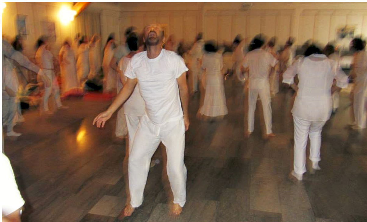
Spontano gibanje in trans izkušnje ob kozmični kirurgiji

Toda najpomembnejše je po letu 2000 šele sledilo. Ko sem avgusta 2000 prešla na življenje brez običajne trdnosnovne hrane, se je odprlo nekaj povsem novega – čudežen medijski kanal za prevajanje Univerzalne kozmične življenjske energije, ki jo za življenje potrebujejo vsa živa bitja. Stik s težko doumljivo (božansko) Inteligenco življenja me je razširil, informacije o tem, kaj se dogaja v ljudeh, pa so v meni postajale iz dneva v dan jasnejše in