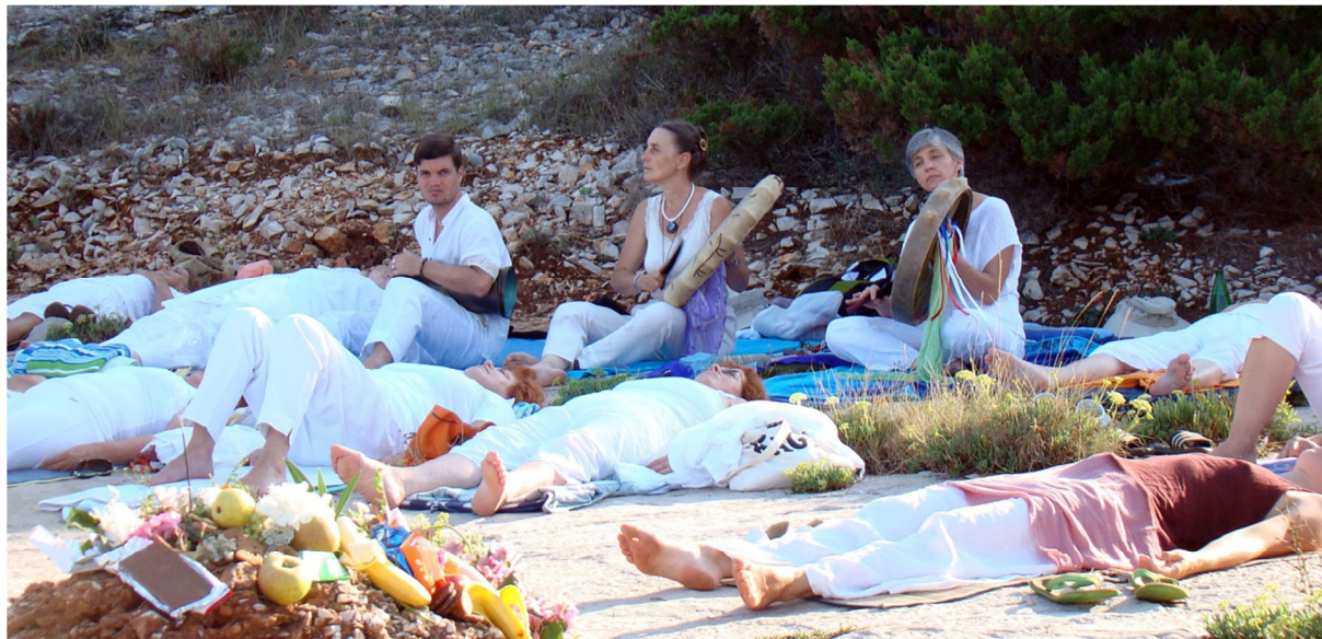
Kozmična iniciacija s kirurgijo na majhnem otočku pri Ižu (2007)