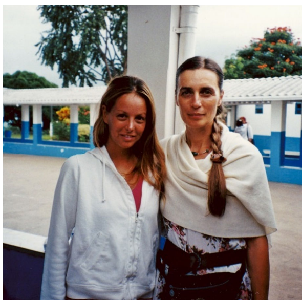
Mirit v Braziliji z deklico iz Čila, ki jo je prvo operirala pod Joavovim vodstvom

Prehod v novo tisočletje in še zlasti prva leta novega tisočletja so bila čas izjemnega, nenavadnega in hitrega spreminjanja, pa tudi čudenja hkrati, saj je bil vsak moj dan oplemeniten z novimi spoznanji in novimi naravnost čudežnimi doživetji – kozmičnega, neslišnega, duhovnega, svetov onkraj, ki si zaslužijo tudi vzdevek pravljichen. To je bil čas prodiranja v tišino Niča, v vsepolno Praznino, v polnino zavesti enosti in razsvetljenja .