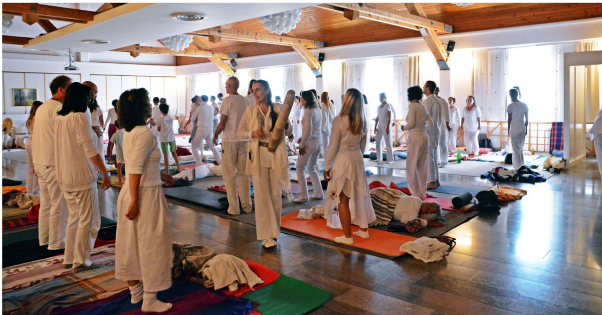
Mirit operira s pomočjo zvoka: z glasom in slovanskim šamanskim bobnom

posegih žal niso nikoli zaceljeni! To lahko in mora napraviti energo-terapevt – medij , sicer odtisi poškodb trajajo dalje ter povzročajo še naprej težave in bolečino. Saj vemo, da človek, ki je izgubil roko ali nogo, še naprej zaznava bolečino na etrskem kalup nivoju; na matrici .