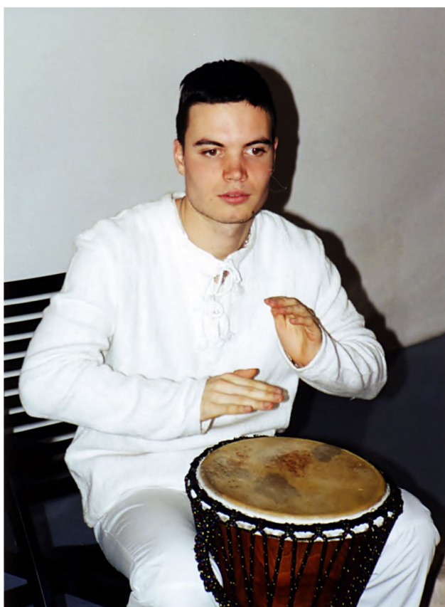
Tine v času duhovnega učenja in v prvih začetkih duhovnega služenja (1999)

Seveda sem hitro ugotovila, da je zelo naporno biti večkratni medij : prevajati kozmične zdravilne energije , biti hkrati tudi medij za zvočno prevajanje in spontano muzicirati, pa istočasno prejemati tudi informacije o tem, kakšne probleme imajo ljudje, ter »loviti« napotke , kaj naj napravijo, da se znebijo težav; pa še pisati in risati hkrati – ej, to niti malo ni več lahko! Zahteva namreč popolno pozornost in tudi fizično moč. Energijski tok skozi telo je silen, kolikor telo pač zmore prenesti, in prav utruji. Kot bi močan električni tok tekel skozte. Obliva te pot, muči te svojevrstna slabost. A telo je tudi prilagodljivo in se sčasoma privadi na nenavadne izventelesne tokove. Ja, res. Sedaj me slabost oblije šele, ko delam na več sto ljudeh hkrati. Očitno moja zavest in telo zmoreta. Kdo ve, koliko časa še? No, po opravljeni kirurgiji si še vso noč buden, kirurgija pa se nadaljuje vse dokler ni opravljeno vse, kar je potrebno. Za vse, ki so zaprosili za pomoč. Prevajanje potrebnih energij se mi vklaplja tudi tekom dneva ali ponoči, pa zvočne vibracije me obiščejo, raznovrstna sporočila in besede – najraje v verzih . Zgodí se tudi vódeni gib, slikovno videnje in celovito za-vedanje . Tovrstno hkratno dogajanje bi najlaže opisala kot močno nuklearno izgorevanje . Po kirurgiji sem običajno še dolgo omotična in zatem obvezno potrebujem počitek, kajti zavest in telo še dolgo po srečanju z ljudmi opravljata svojo kirurško vlogo, včasih vso