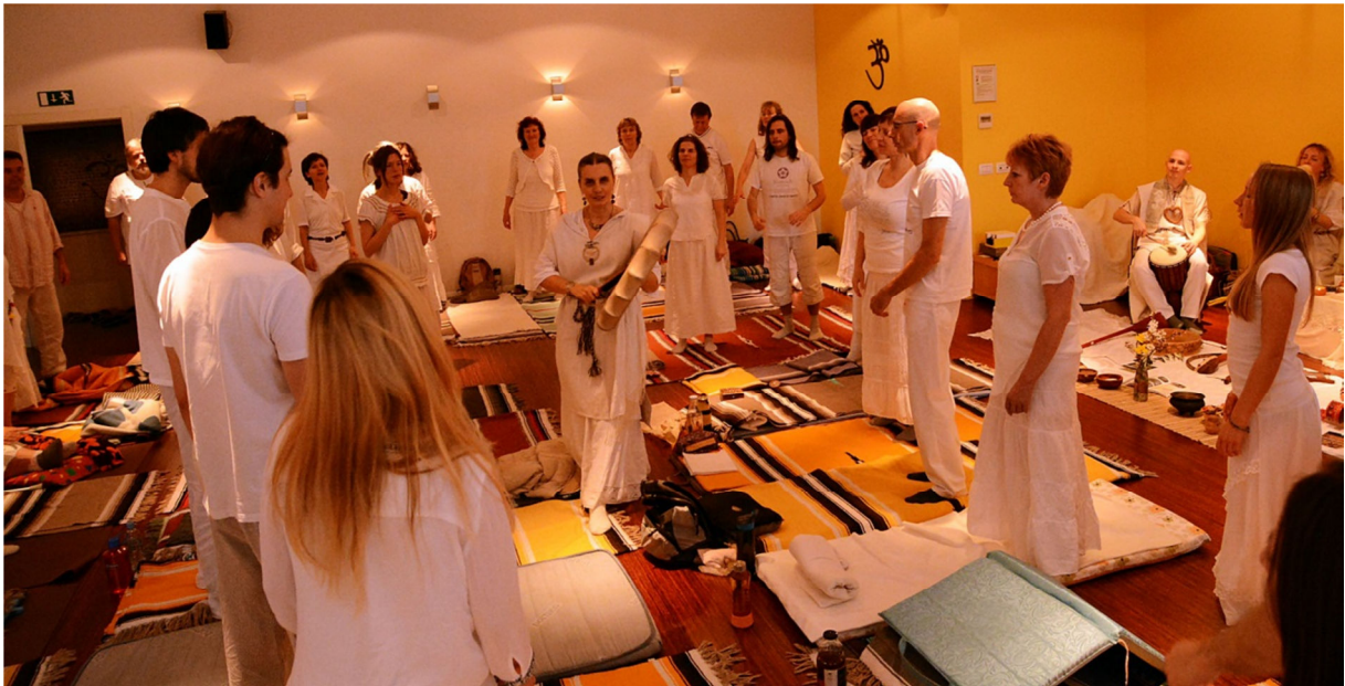
Svečana kirurgija na Mirinih tečajih (intenziv o Slovanih, Ljubljana, 2016)

Moja prva izkušnja kozmične kirurgije v Braziliji mi je v naslednjih letih dajala moč in navdih za kasnejša iskanja. Vedela sem, da bo kmalu prišel čas, ko bom morala nekaj podobnega opravljati tudi sama, vendar sem dovolila času čas; da se to novo razvije in odvije ter vzpostavi, ko bodo pogoji za to neverjetno zdravljenje docela vzpostavljeni , jaz pa povsem pripravljena. Nekajkrat se mi je tudi že v Braziliji spontano vzpostavila kratka zvočna kirurgija . A trajna kozmična zvočno-energijska kirurgija je bila nekaj zelo drugačnega in mogočnejšega. Nekaj zelo mojega!