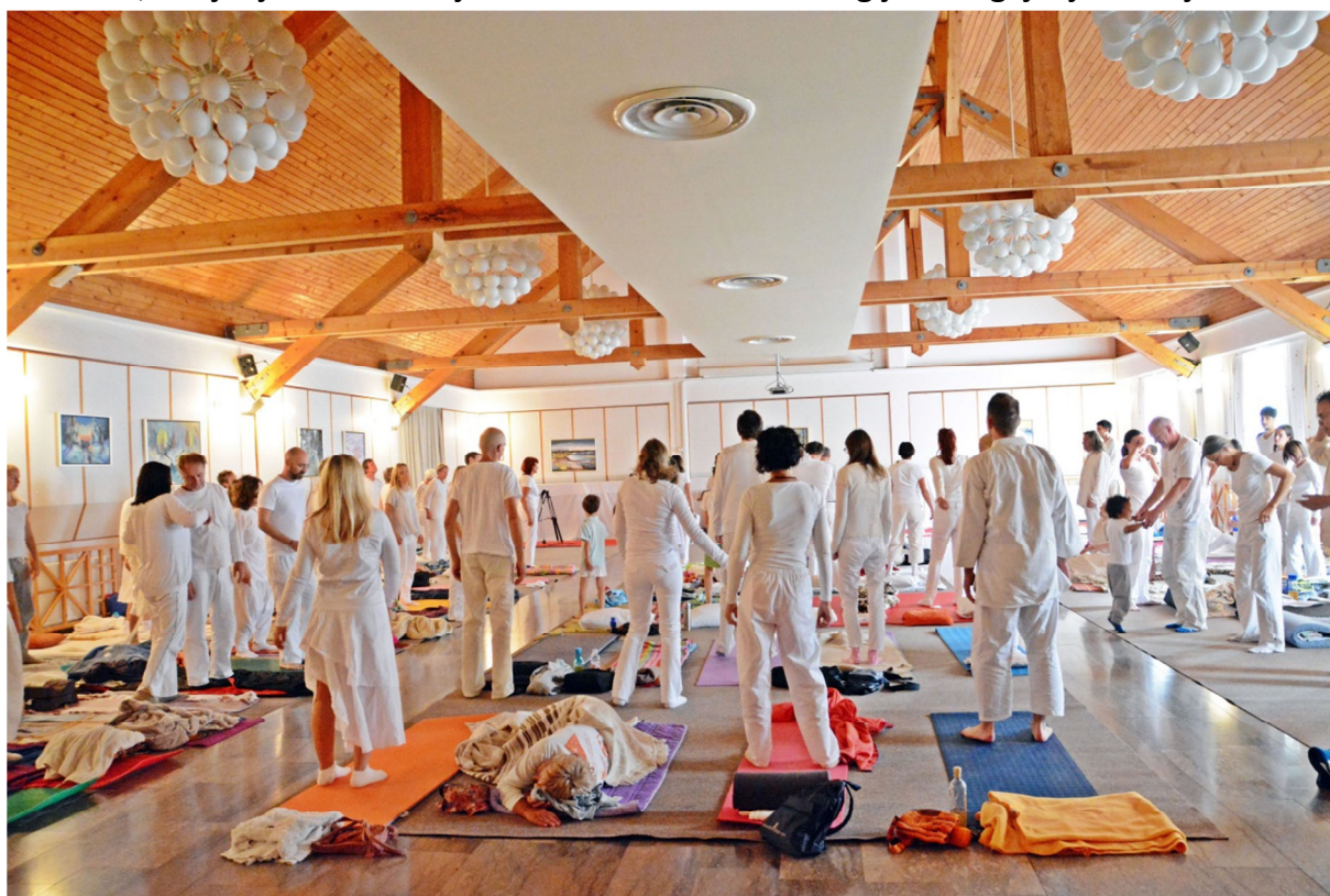
Kozmična zvočno-energijska kirurgija na tečaju na Rogli (2014)

Zvok je energija in bit življenja. Pravzaprav je magično orodje in neverjetno čudo. V prvih letih glasbenega ustvarjanja in poustvarjanja glasbenega izročila Slovenije in sveta v okviru ansamblov Trutamora Slovenica in Vedun, se mi ni niti še sanjalo, da se bo umetniško delovanje spremenilo v nekaj tako izjemnega, kot je kozmična zvočno-energijska kirurgija. Vse se je odvijalo postopoma in spontano. Zvok, ki je temeljni gradnik vsake glasbe, je postajal vse subtilnejši, prodornejši, učinkovitejši ... Ko smo z ansamblom Trutamora Slovenica (kasneje Vedun) predstavljali ljudem slovensko glasbeno dediščino, kasneje pa tudi svetovno, so ljudje vse močnejše občutili nenavadno energijsko dogajanje v svojih telesih.