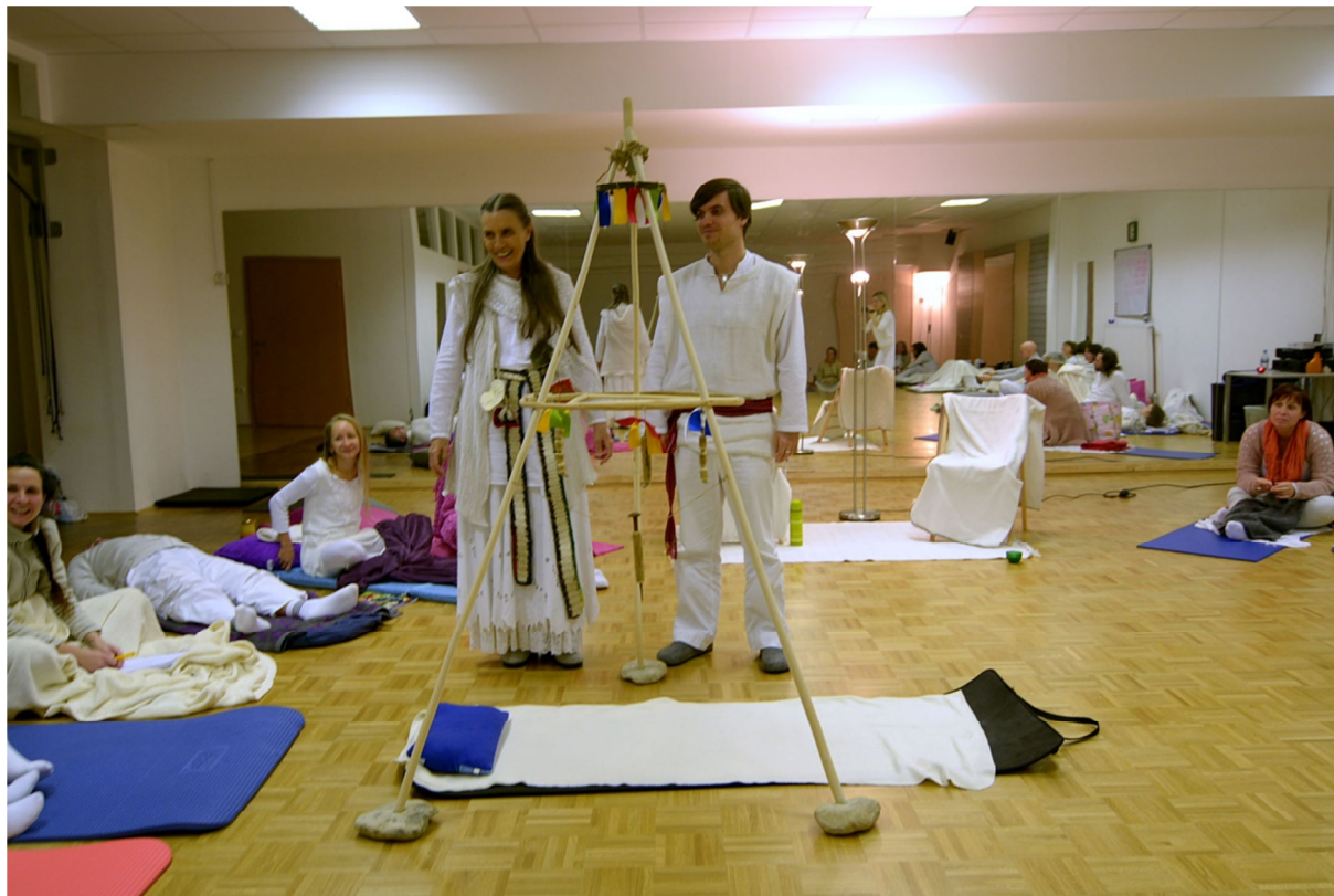
V letu 2016 in 2017 je dodana še kirurgija s staroslovenskim trojkom

noč vse do jutra. Dokler je pač treba. Naporno, a vseeno lepo.