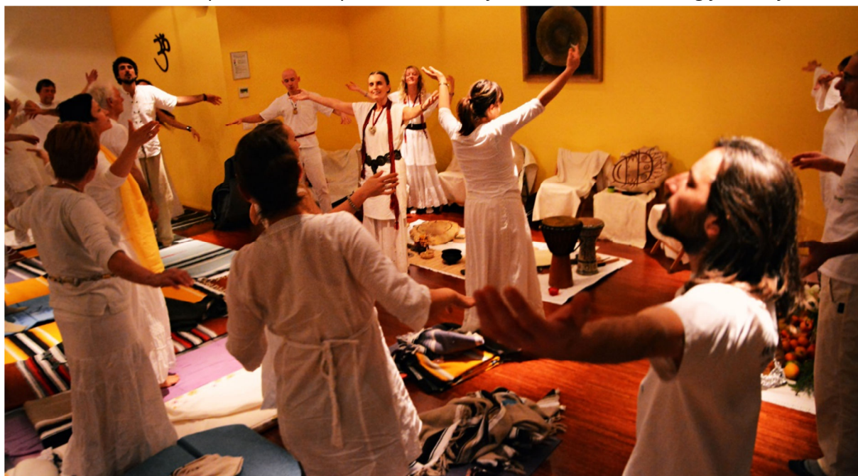
S kirurgijo v svobodo

Na Filipinih sem imela možnost prisostvovati in sodelovati s tamkajšnjimi najbolj znanimi kirurgi. Ti so še danes prepričani, da njihovo znanje izvira iz davne modrosti legendarne Lemurije in Atlantide . To vez ne samo spoštujejo, temveč jo tudi negujejo , zato se pred vsako kirurgijo zavestno povežejo s to mitično deželo izjemnih možnosti. Zvočnega kirurga na Filipinih nisem sicer srečala nikjer (pa tudi v Braziliji ne), a so mi vsi kirurgi, ki sem jih obiskala in ki so mi ponudili tudi prva izkustva njihove kozmične kirurgije, zatrjevali, da