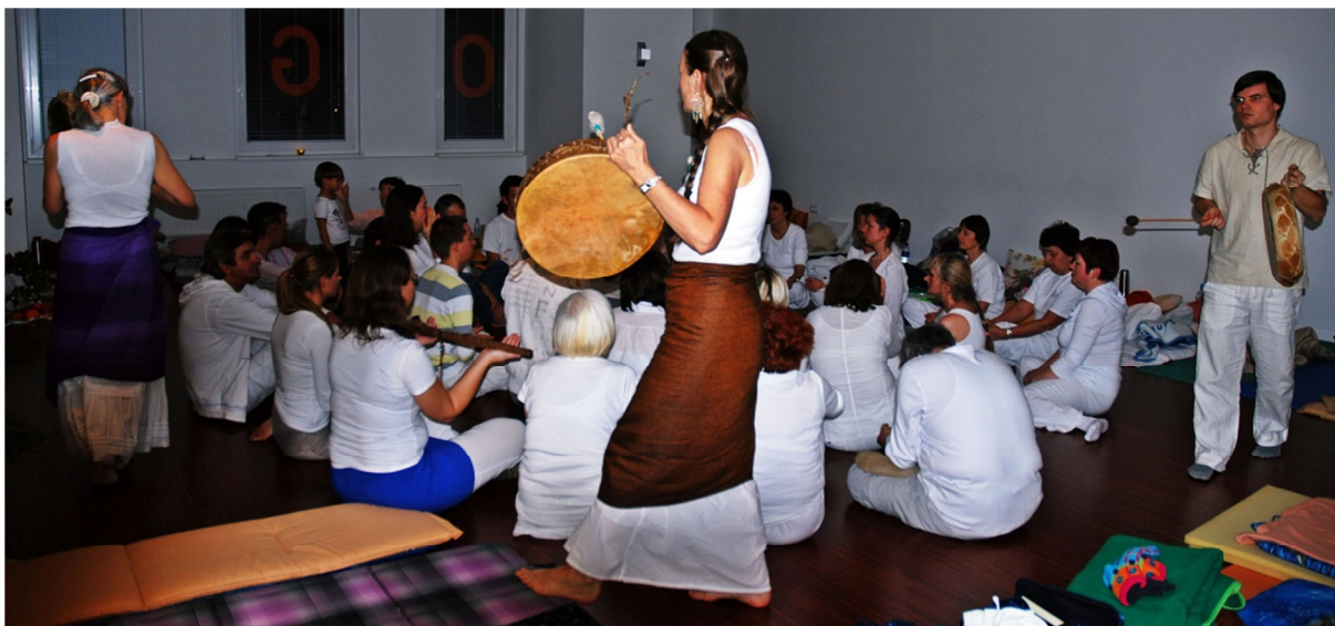
Kirurgija s svetimi ritmi Indijancev na Veduna tečaju (Ljubljana, 2010)

Seveda sem hitro ugotovila, da je zelo naporno biti večkratni medij : prevajati kozmične zdravilne energije , biti hkrati tudi medij za zvočno prevajanje in spontano muzicirati, pa istočasno prejemati tudi informacije o tem, kakšne probleme imajo ljudje, ter »loviti« napotke , kaj naj napravijo, da se znebijo težav; pa še pisati in risati hkrati – ej, to niti malo ni več lahko! Zahteva namreč popolno pozornost in tudi fizično moč. Energijski tok skozi telo je silen, kolikor telo pač zmore prenesti, in prav utruji. Kot bi močan električni tok tekel skozte. Obliva te pot, muči te svojevrstna slabost. A telo je tudi prilagodljivo in se sčasoma privadi na nenavadne izventelesne tokove. Ja, res. Sedaj me slabost oblije šele, ko delam na več sto ljudeh hkrati. Očitno moja zavest in telo zmoreta. Kdo ve, koliko časa še? No, po opravljeni kirurgiji si še vso noč buden, kirurgija pa se nadaljuje vse dokler ni opravljeno vse, kar je potrebno. Za vse, ki so zaprosili za pomoč. Prevajanje potrebnih energij se mi vklaplja tudi tekom dneva ali ponoči, pa zvočne vibracije me obiščejo, raznovrstna sporočila in besede – najraje v verzih . Zgodí se tudi vódeni gib, slikovno videnje in celovito za-vedanje . Tovrstno hkratno dogajanje bi najlaže opisala kot močno nuklearno izgorevanje . Po kirurgiji sem običajno še dolgo omotična in zatem obvezno potrebujem počitek, kajti zavest in telo še dolgo po srečanju z ljudmi opravljata svojo kirurško vlogo, včasih vso